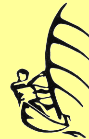
Planche à voile

La Rincerie (53) Hébergement sous tente !